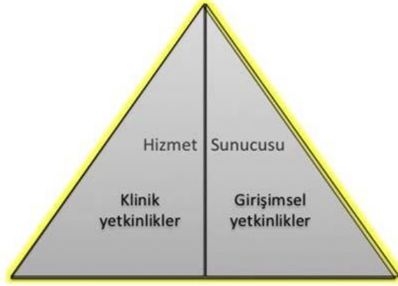
Şekil 2- TUKMOS yedinci temel yetkinlik alanı: Hizmet Sunucusu

Girişimsel Yetkinlik: Bilgiyi, kişisel, sosyal ve/veya metodolojik becerileri tıbbi girişimler konusunda kullanabilme yeteneğidir.